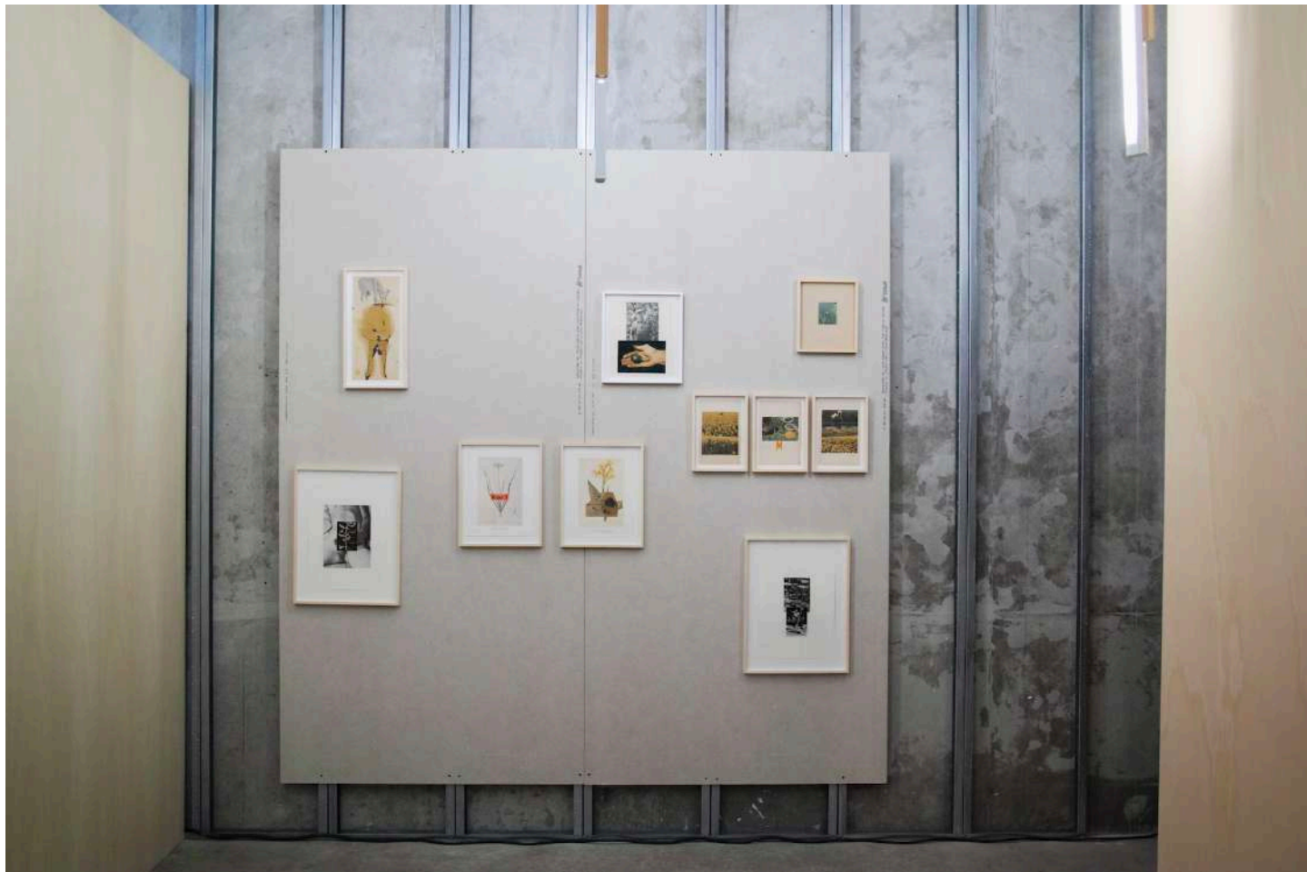
vue exposition Pierre Creton | Rubus ! Rubus ! | Salle Principale | du 16 janvier au 23 mars 2025