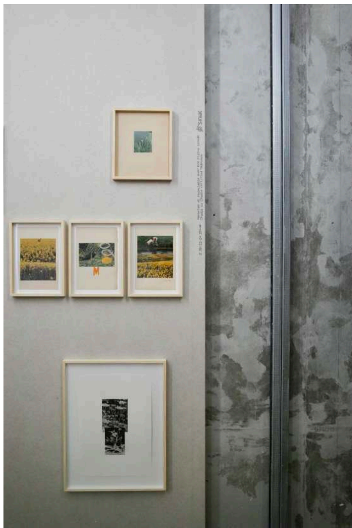
vue exposition Pierre Creton | Rubus ! Rubus ! | Salle Principale | du 16 janvier au 23 mars 2025