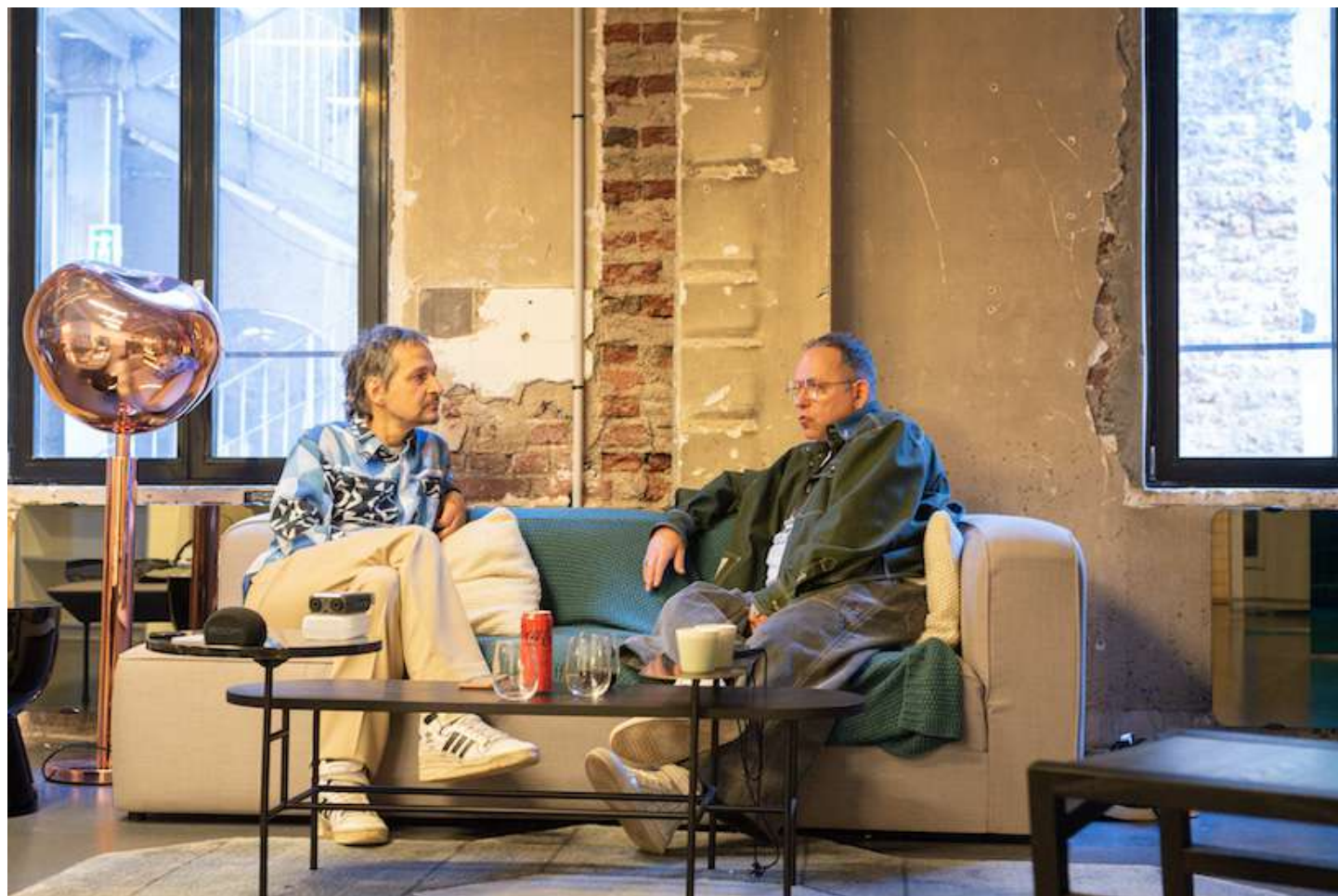
les gens d'Uterpan (Franck Apertet), Désorganigramme | Salle Principale | du 28 mars 2023 au 29 juin 2024

action | Parler dans un endroit public des problématiques que rencontre la création aujourd'hui en regard de certains protocoles, stratégies et procédures historiques des gens d'Uterpan