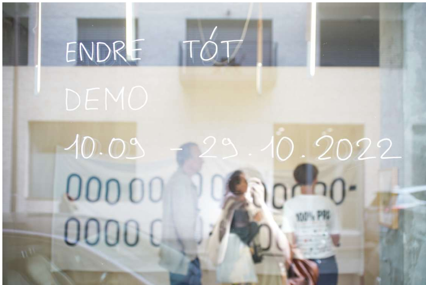
vue exposition Endre Tót, Demo | Salle Principale | du 10 septembre au 29 octobre 2022