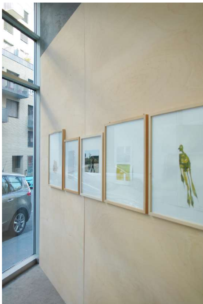
vues exposition Lois Weinberger, Un lieu... | Salle Principale | du 17 octobre 2018 au 12 janvier 2019