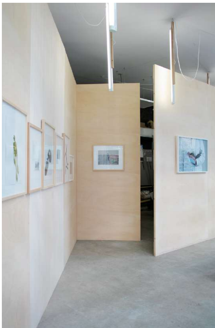
vues exposition Lois Weinberger, Un lieu... | Salle Principale | du 17 octobre 2018 au 12 janvier 2019