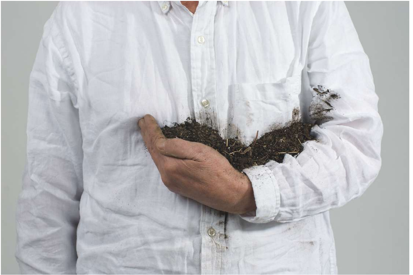
Lois Weinberger | Holding the Earth | 2010 | photographie | 60 x 90 cm