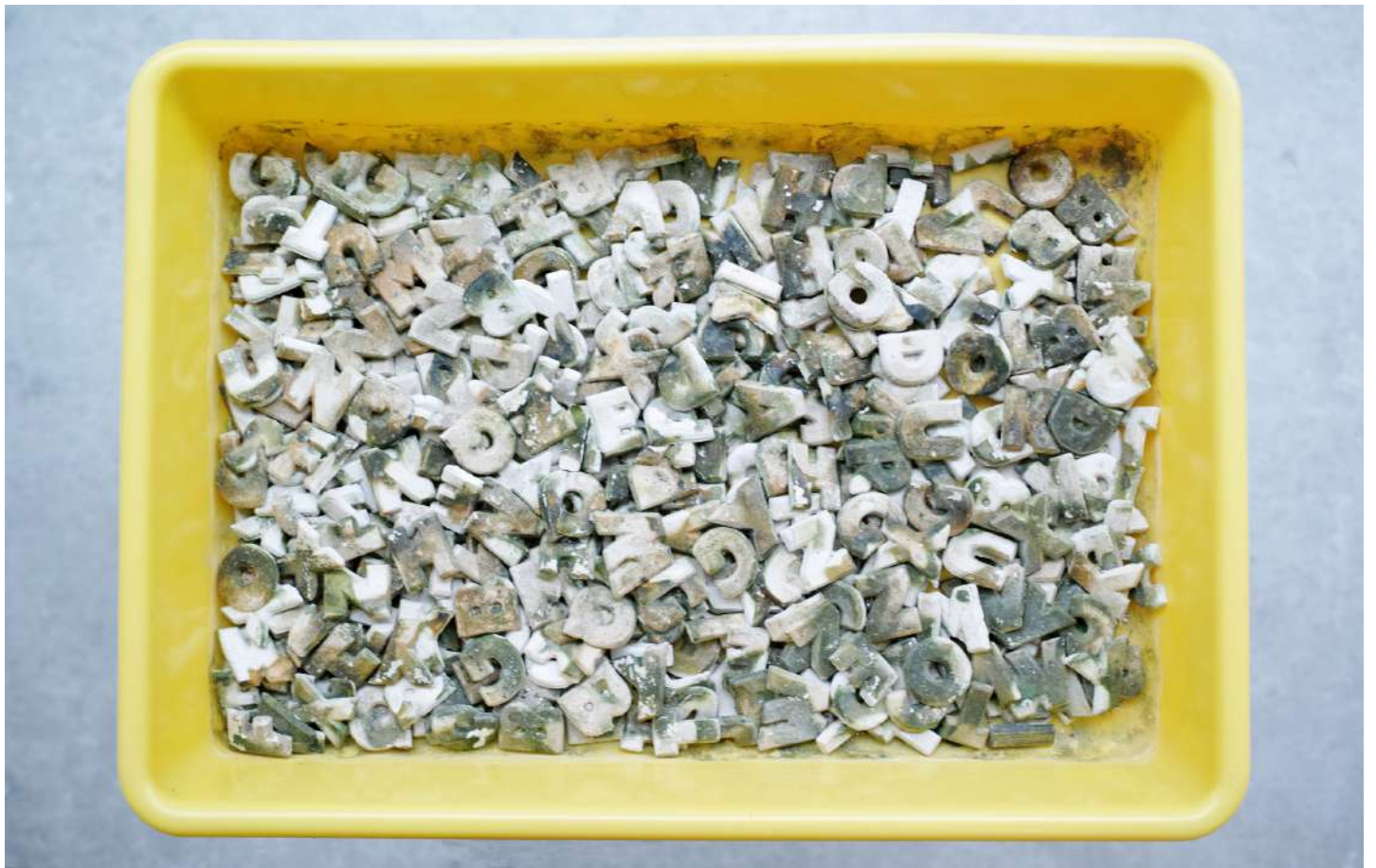
Lois Weinberger | Garden | années 1990 | lettre terre cuite, mousse végétale, bac pvc | 53 x 38 x 9 cm