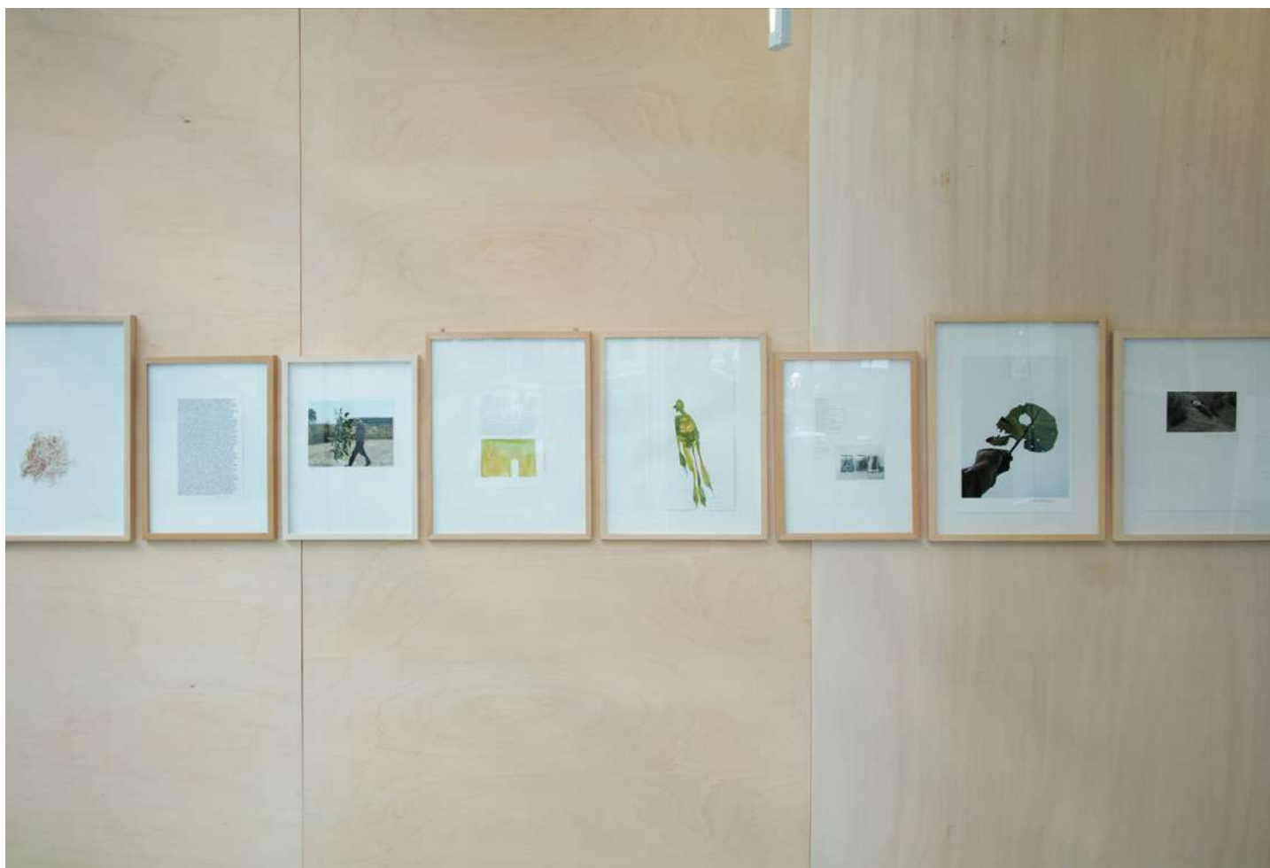
vues exposition Lois Weinberger, Un lieu... | Salle Principale | du 17 octobre 2018 au 12 janvier 2019