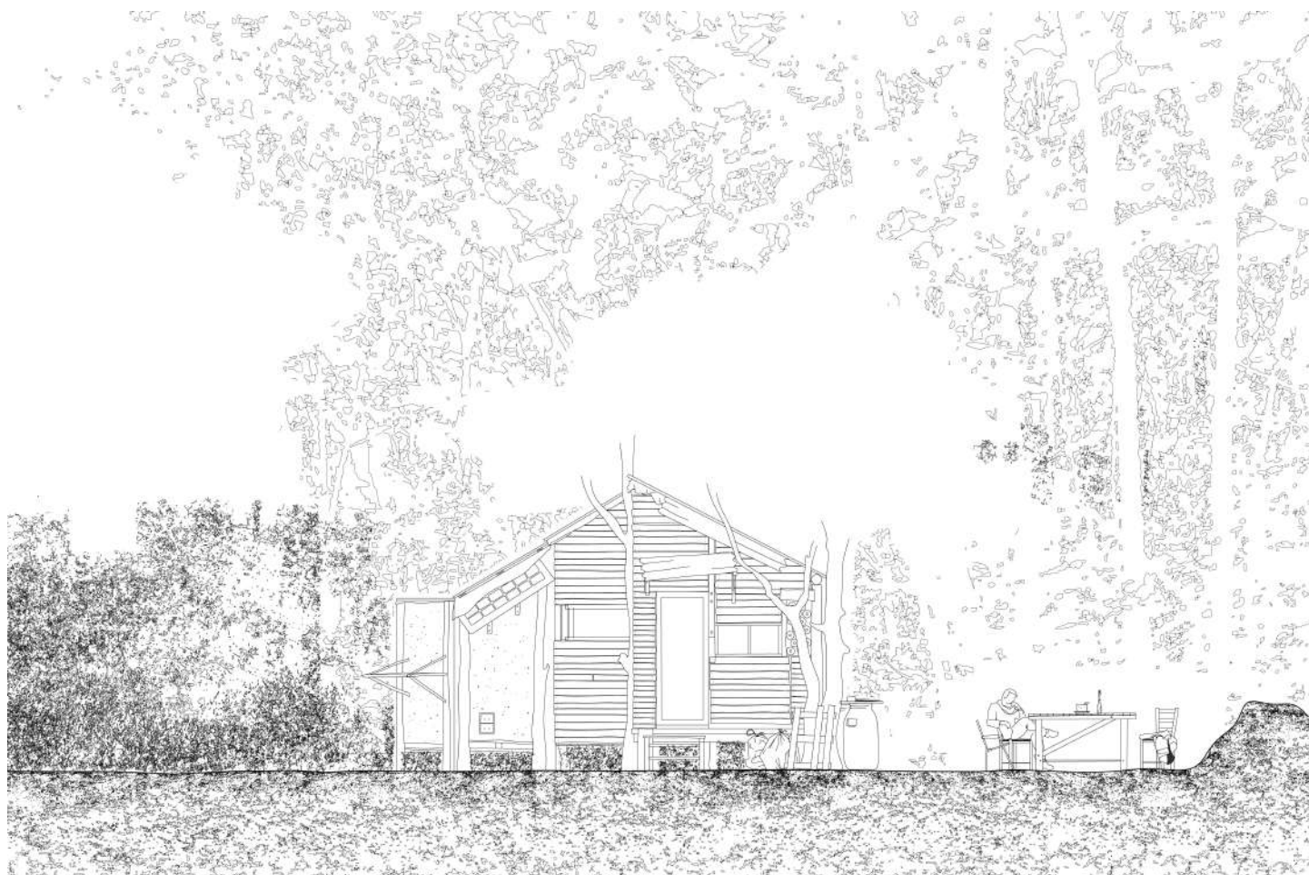
La Noue non plus | 2018 | dessin mural réalisé par les étudiants du DSAA Alternatives urbaines (Vitry-sur-Seine)