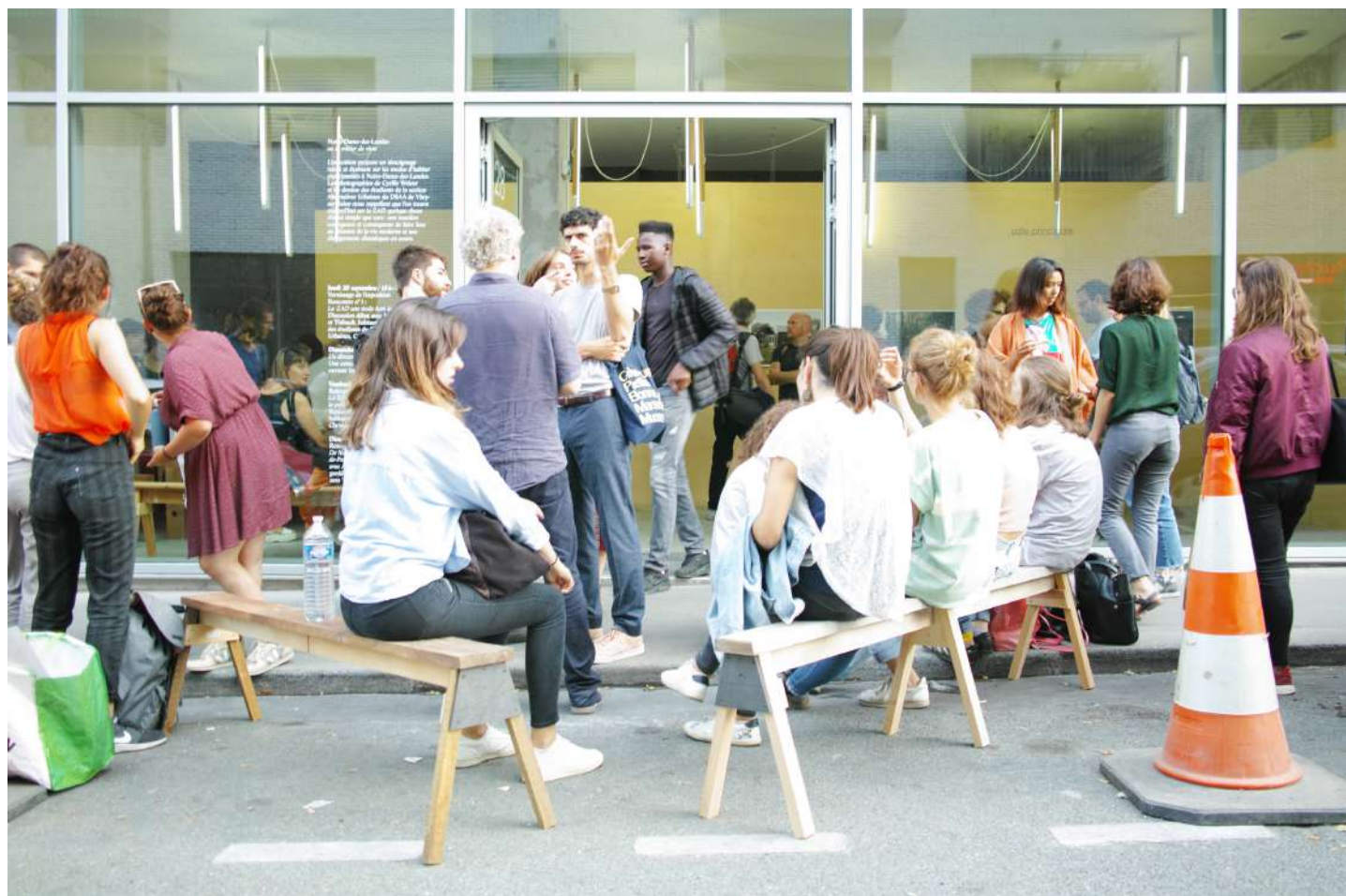
vernissage | Notre-Dame-des-Landes ou le métier de vivre | exposition collective | Salle Principale | du 20 septembre au 07 octobre 2018