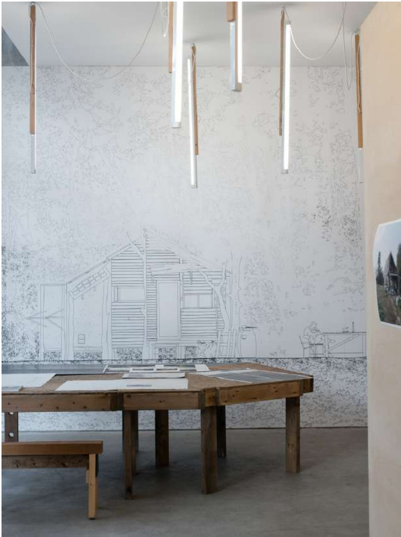
vue exposition | Notre-Dame-des-Landes ou le métier de vivre | exposition collective | Salle Principale | du 20 septembre au 07 octobre 2018