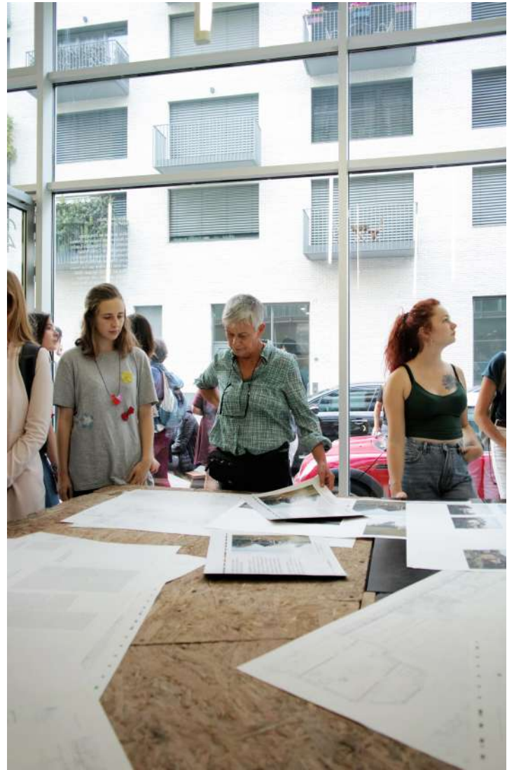
vue exposition | Notre-Dame-des-Landes ou le métier de vivre | exposition collective | Salle Principale | du 20 septembre au 07 octobre 2018