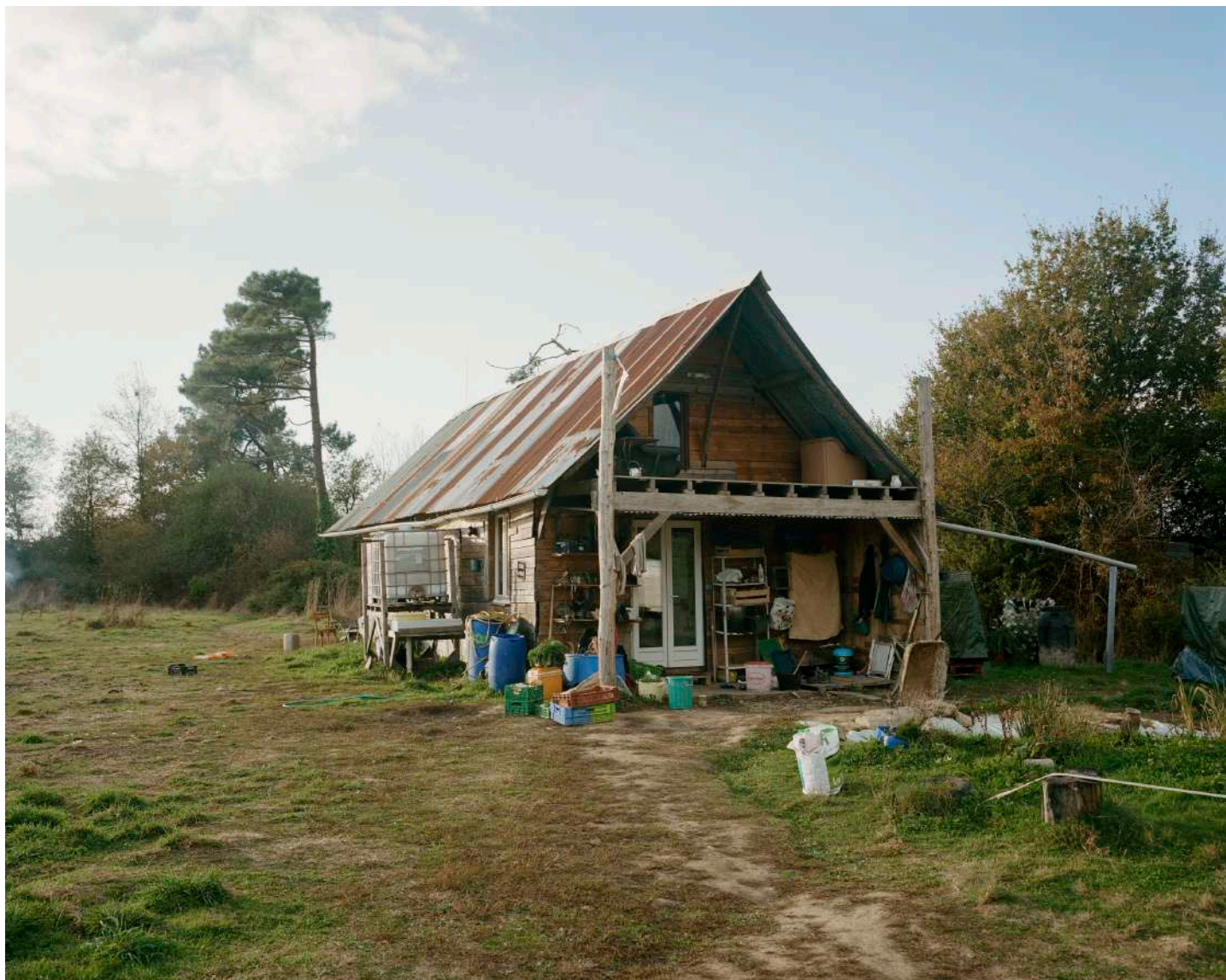
Cyrille Weiner | Les 1000 noms | 2018 | photographie | 50 x 60 cm