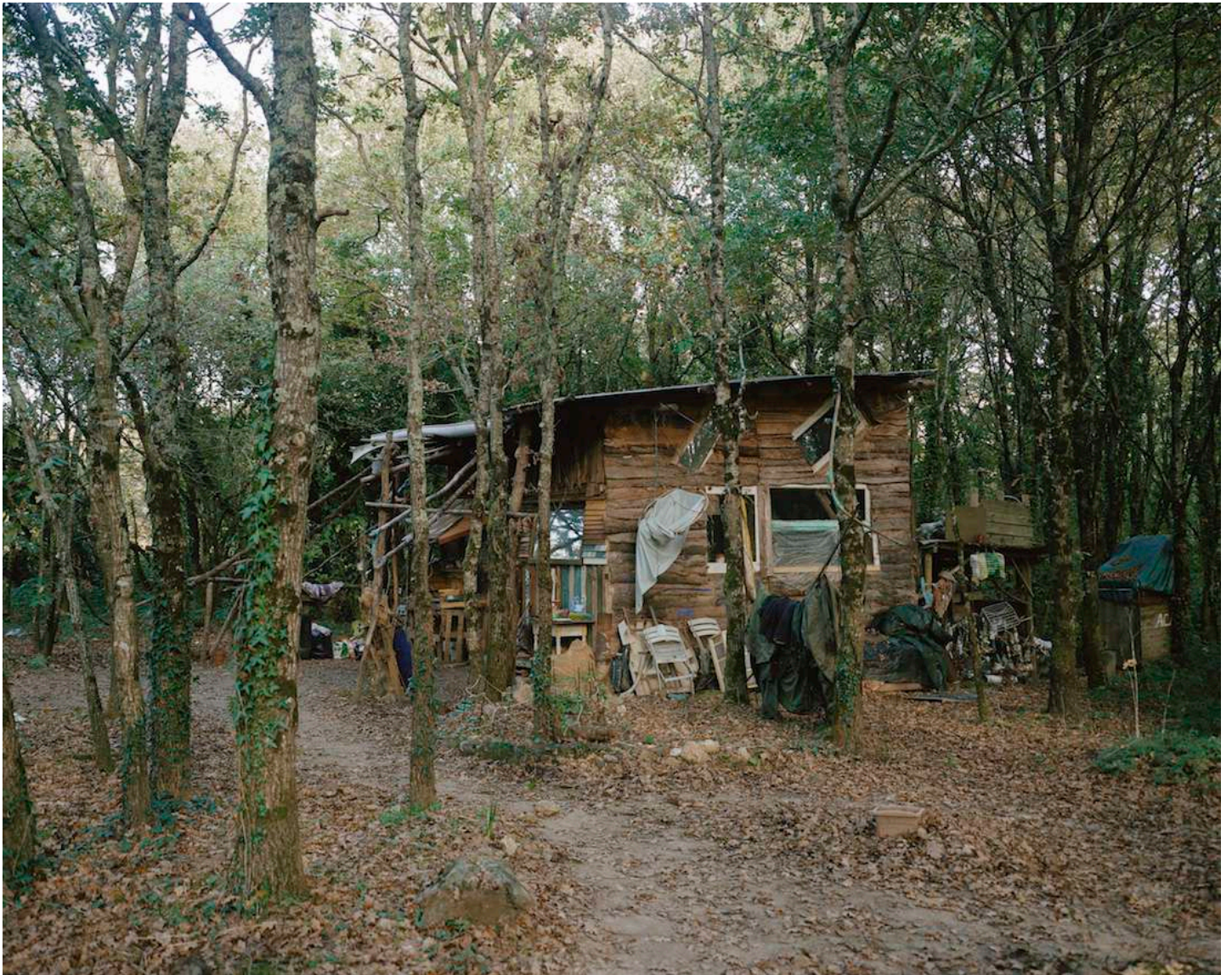
Cyrille Weiner | Le Port, à côté de l'étang | 2018 | photographie | 50 x 60 cm