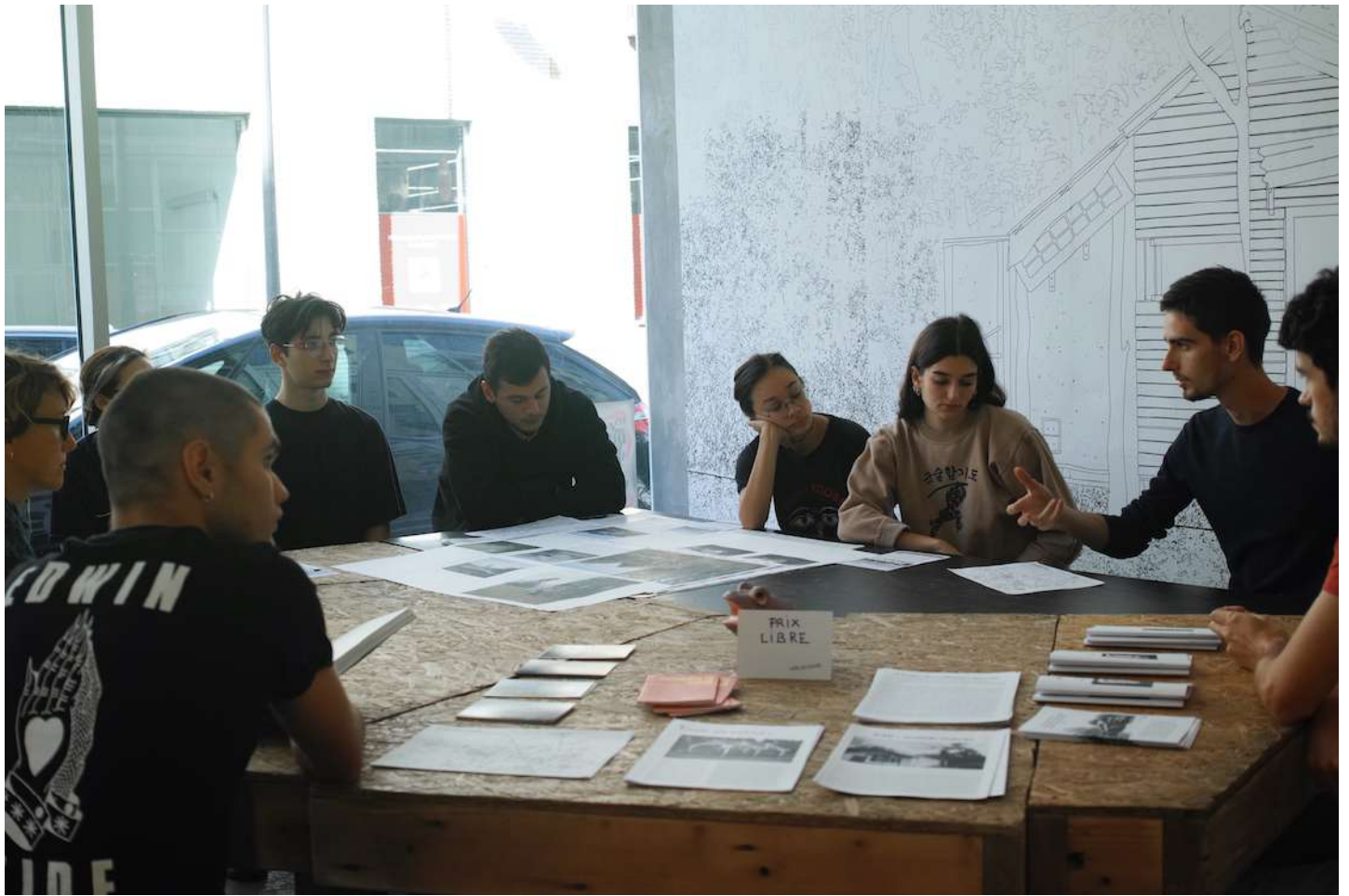
rencontre entre les étudiants du DSAA Alternatives urbaines et les étudiants de l'Ecole des Arts Décoratifs de Paris | Notre-Dame-des-Landes ou le métier de vivre | exposition collective | Salle Principale | du 20 septembre au 07 octobre 2018