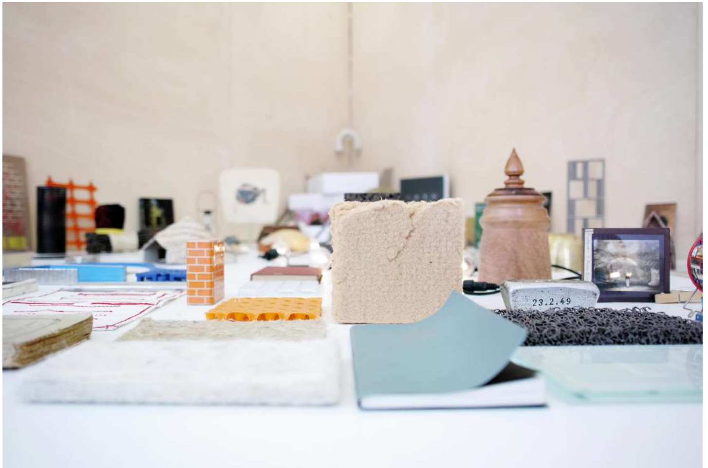
vue exposition Patrick Bouchain, A la source | Salle Principale | du 21 octobre 2016 au 14 janvier 2017

Cabinet de curiosité - 2 | 2016 | objets divers, livres