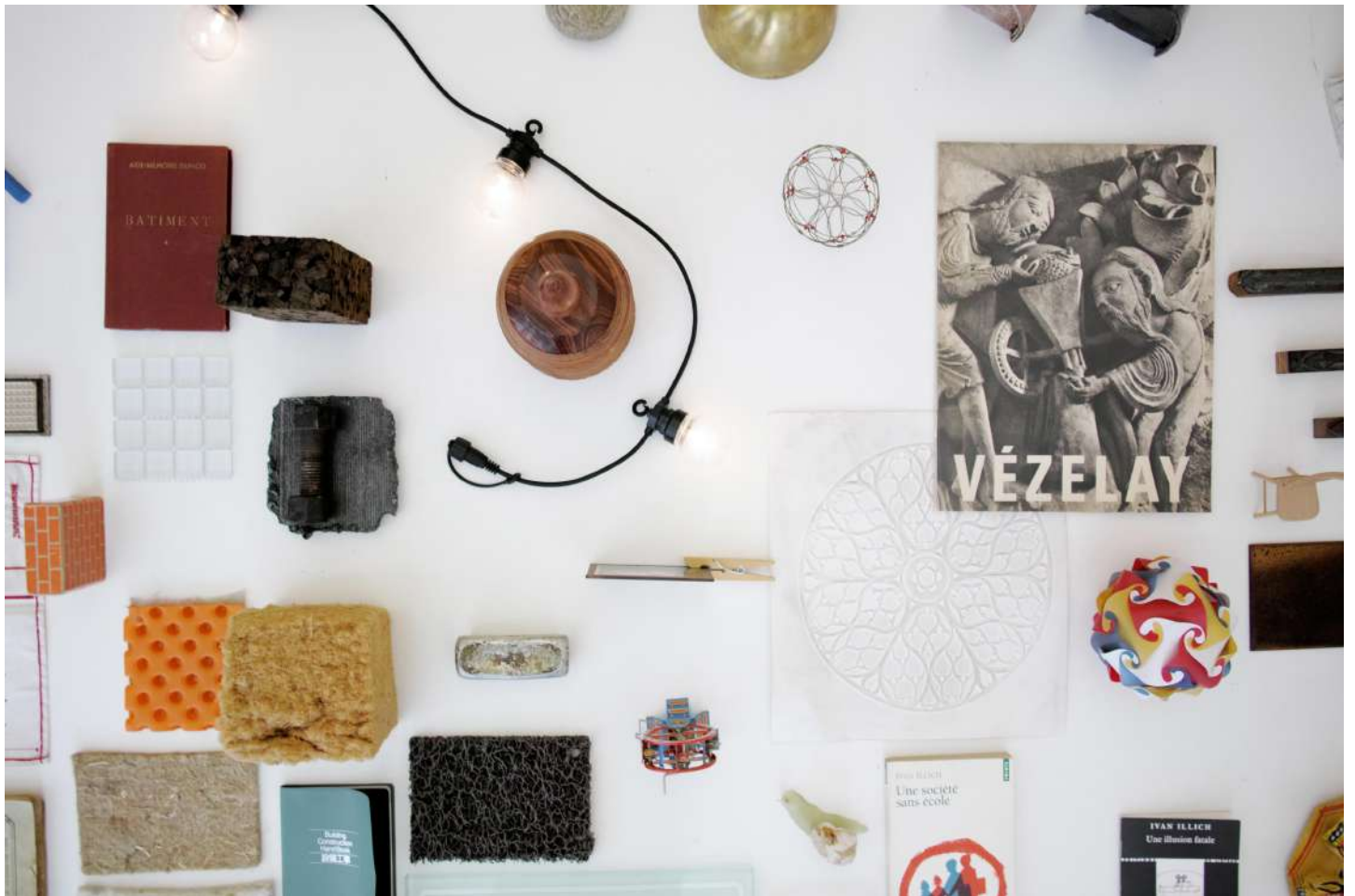
vue exposition Patrick Bouchain, A la source | Salle Principale | du 21 octobre 2016 au 14 janvier 2017

Cabinet de curiosité - 2 | 2016 | objets divers, livres