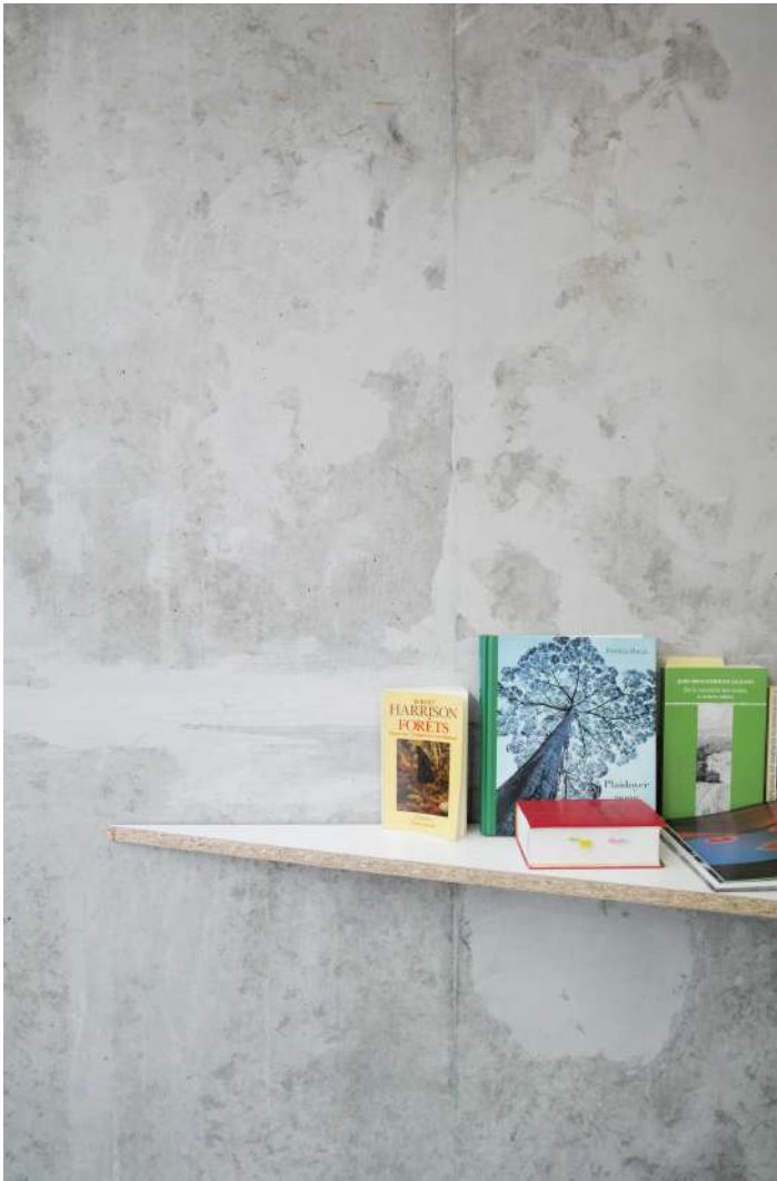
vue exposition Patrick Bouchain, A la source | Salle Principale | du 21 octobre 2016 au 14 janvier 2017