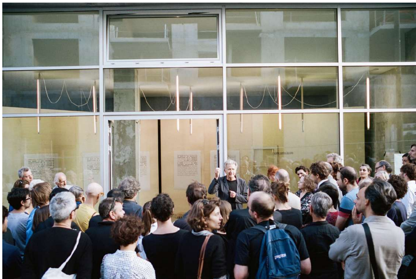
vue exposition Patrick Bouchain, Tambour battant | Salle Principale | du 13 septembre au 15 novembre

Cyrille Weiner | conférence Patrick Bouchain | 2014 | photographie | 26 x 40 cm