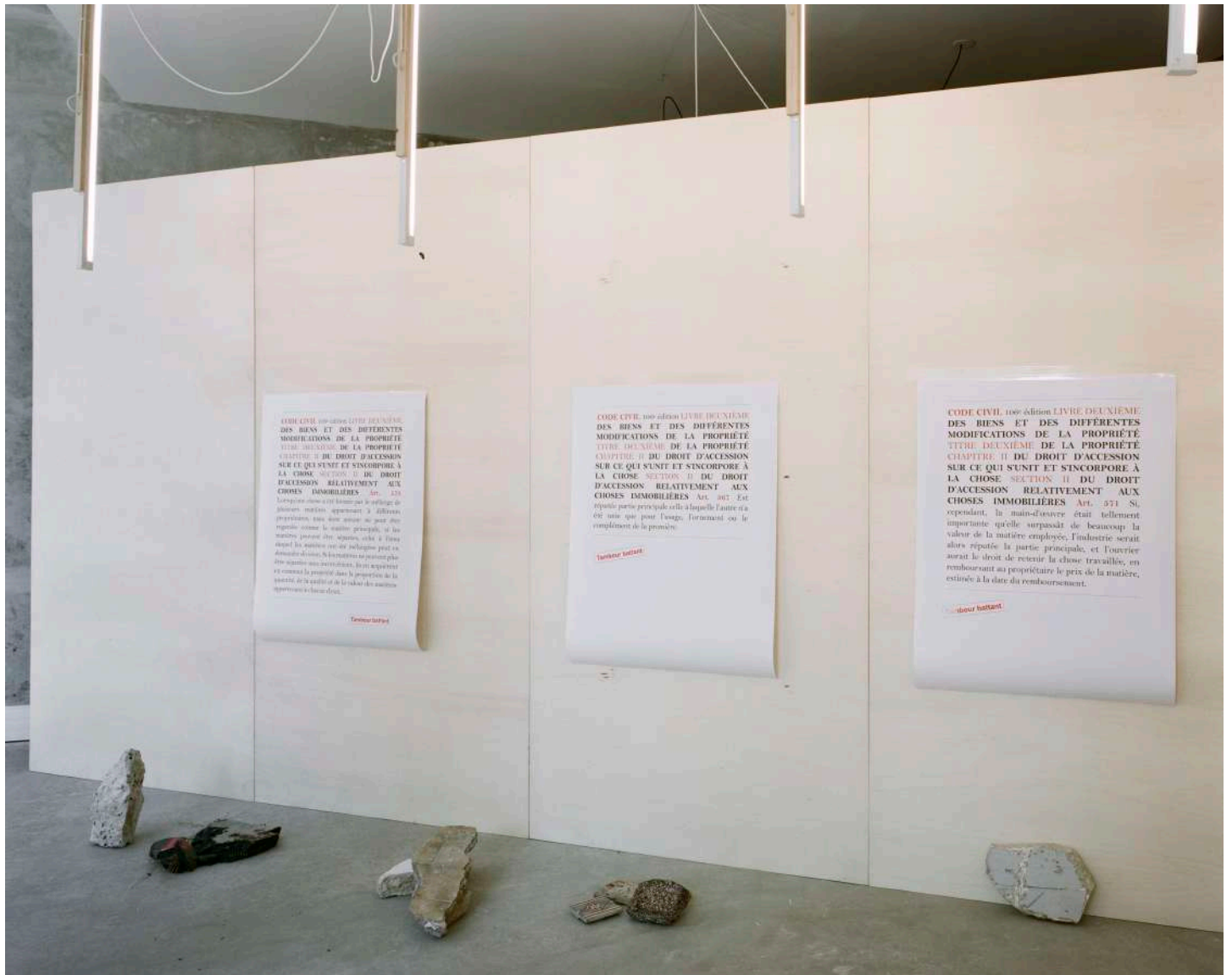
vue exposition Patrick Bouchain, Tambour battant | Salle Principale | du 13 septembre au 15 novembre 2014