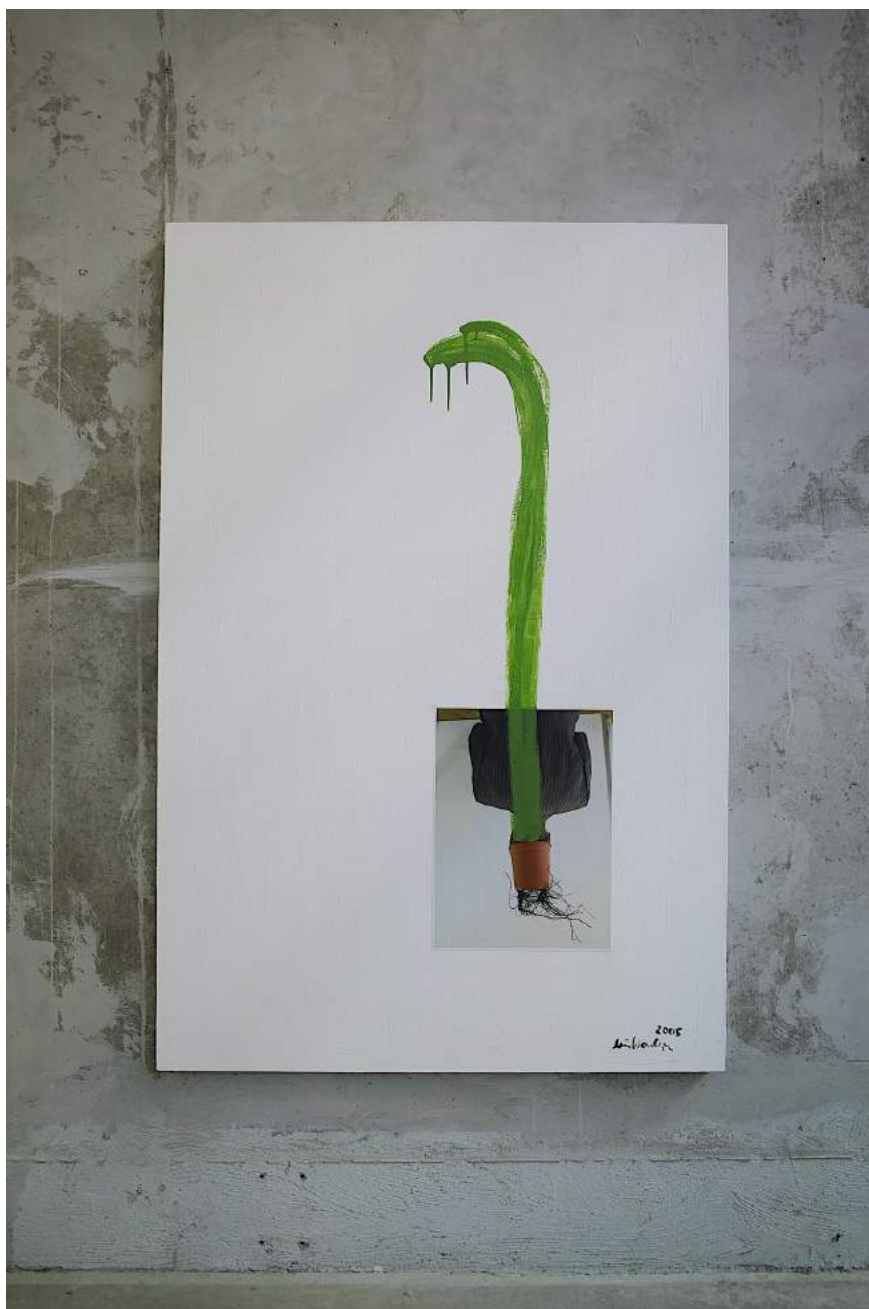
Lois Weinberger Untitled (root head), 2005 pigment print mounted on canvas, acrylic 150 x 100 cm unique