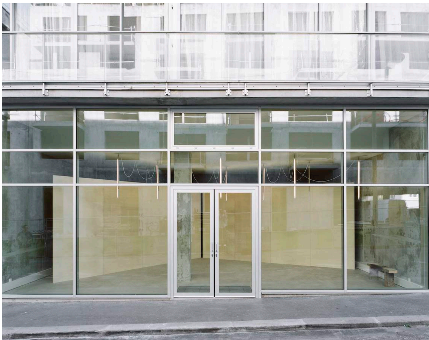
Salle Principale, Paris

L'ouverture de la galerie Salle Principale en septembre 2014 est née de la volonté de réunir des figures travaillant aux marges des pratiques artistiques, issues de disciplines et de générations différentes, afin d'établir des dialogues à même de donner une représentation acérée et audacieuse de notre environnement contemporain.