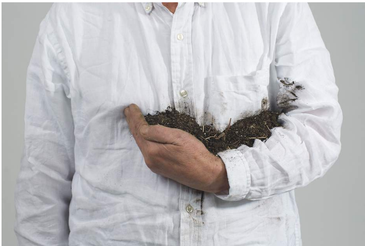
Lois Weinberger Untitled (Holding the Earth), 2010 photographic work, pigment print on Archival Matte Paper framed, 60 x 90 cm ed. 5 + 3 a.p.