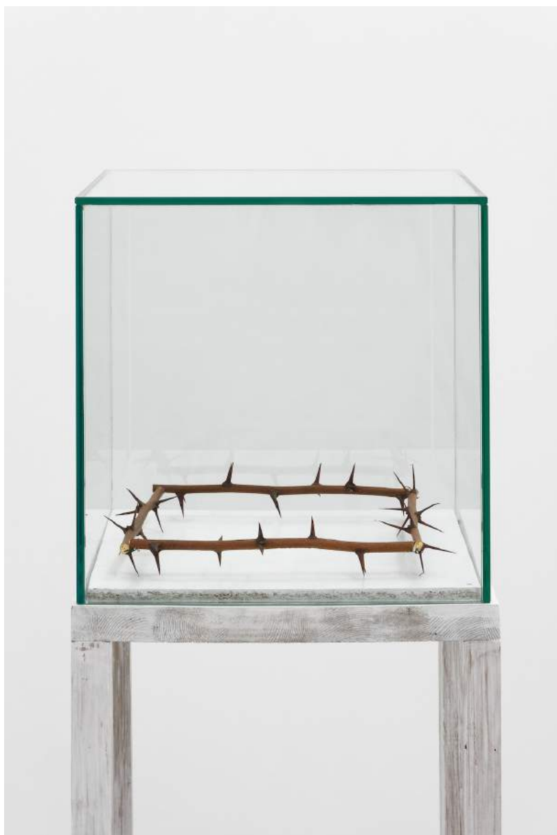
Lois Weinberger Catholic Mondrian, 1994 acacia branches 20 x 20 cm glass case 30 x 30 cm / wooden table painted by the artist H.160 cm unique