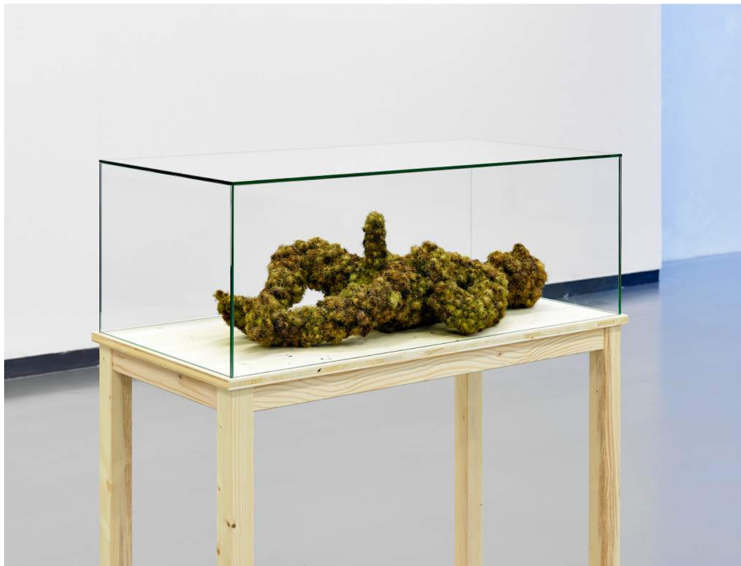
Lois Weinberger Green Man, 2010 sculpture Arctium lappa 68 x 35 x 20 cm, glass vitrine 100 x 52 x h. 40 cm ed. 7 (two available) each unique courtesy Salle Principale, Paris © Studio Lois Weinberger