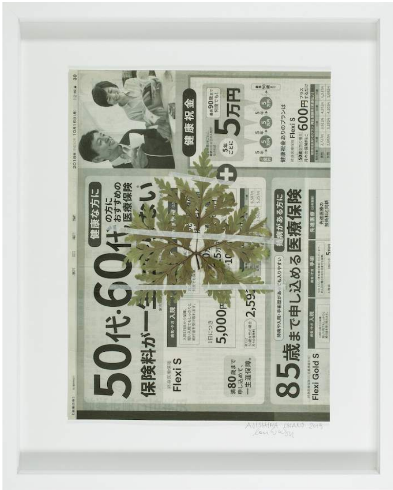
Lois Weinberger Aijshima Island, Japan 2019 collage, herbarium, pigment print on archive paper 52,5 x 42,5 x 4 cm unique