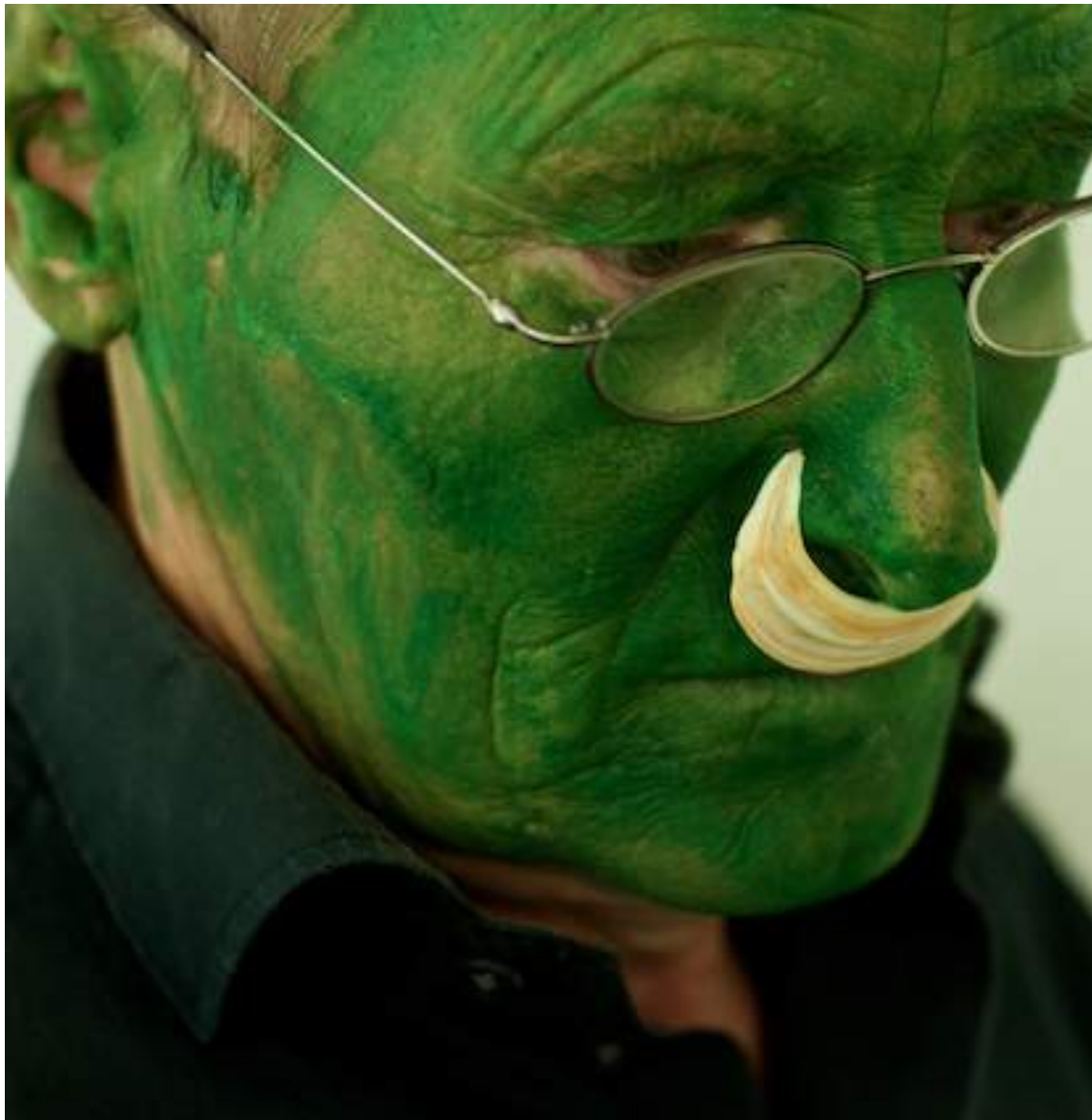
Lois Weinberger Green Man, 2004 photographic work, pigment print on Archival Matte Paper framed 105 x 105 cm ed. 4/5 + 3 a.p.